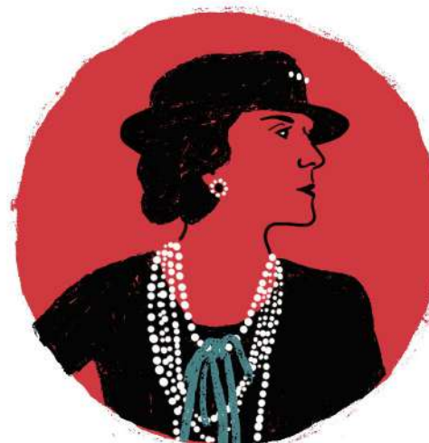
Coco Chanel Diseñadora de moda

“Una mujer debe ser dos cosas: quien ella quiera y lo que ella quiera”