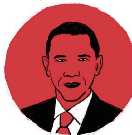
Barack Obama Expresidente de Estados Unidos

“Cuando eres padre de dos hijas te das cuenta de los estereotipos sociales y puedes sentir la enorme presión en cuanto aspecto, comportamiento e incluso forma de pensar a la que las mujeres están sometidas”