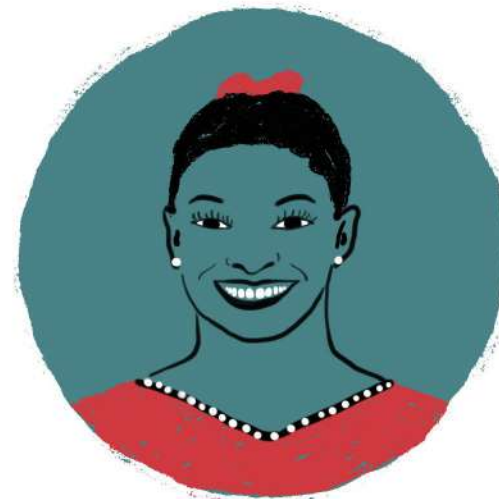
Simone Biles Gimnasta

“No soy la próxima Usain Bolt o Michael Phelps: soy la primera Simone Biles”