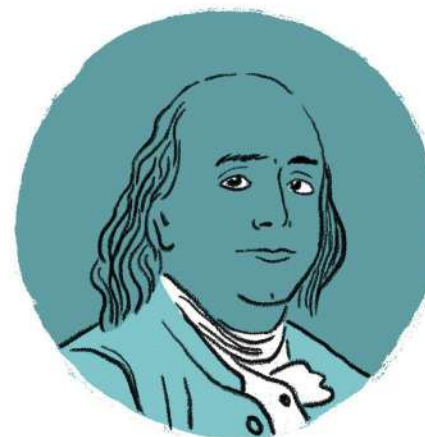
Benjamin Franklin Político

“Educar en la igualdad y el respeto es educar contra la violencia”