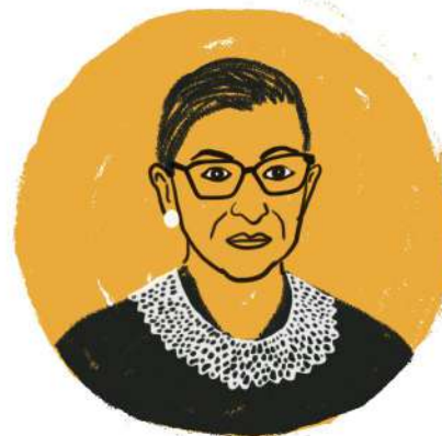
Ruth Bader Ginsburg Jueza del Tribunal Supremo de Estados Unidos

“Las mujeres habrán alcanzado la verdadera igualdad, cuando los hombres compartan con ellas la responsabilidad de criar a la próxima generación”.